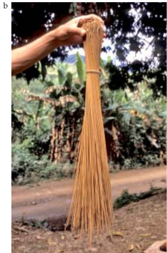
Fig. 3: a: Aiphanes grandis . Esta especie endémica de las laderas occidentales de los Andes de Ecuador produce palmito comestible, así como inflorescencias inmaduras y frutos que son usados para diversas preparaciones. Foto: F. Borchsenius, provincia El Oro, Ecuador. b: Attalea phalerata . Escoba elaborada de los nervios centrales de las pinnas. Foto: M. Moraes, provincia Nor Yungas, Bolivia.