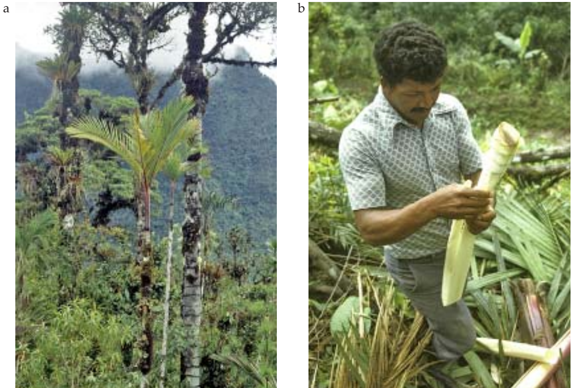
Fig. 5: a. Individuo de elevadas altitudes de Prestoea acuminata en crestas expuestas del sur de Ecuador. b. Palmito extraído de P. acuminata , cerca a Quito, Ecuador.

palmito (Bonilla & Feil 1995). La exportación total de palmito del Ecuador – basada en la extracción de manchas silvestres de P. acuminata y E. oleracea alcanzaron aproximadamente a 900 toneladas métricas en 1991, correspondiendo a un valor de cerca de $US 1.5 millones, resultando en una severa disminución de los sitios naturales de ambas especies (Pedersen 1993). El aporte de cada especie no es conocido, ya que el palmito tiene un único registro en las estadísticas de exportación. Debido a que la extracción de palmito ha sido ampliamente reemplazada por la cosecha de plantaciones de Bactris gasipaes , que está establecida en la mayor parte de las tierras bajas del W de Ecuador y parece haber cesado el procesamiento industrial de palmito procedente de poblaciones silvestres.