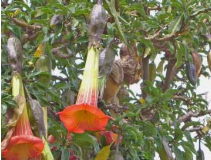
Fig. 1: Detalle de la flor de Brugmansia sanguinea , denominado floripondio boliviano en Bolivia.

(Perú) y allí los shamanes también cultivan estas plantas en sus jardines personales (De Feo 2004). Cada shaman tiene sus variedades preferidas de Brugmansia que parcialmente sirven para propósitos medicinales y también para ser ingeridos cuando tienen que analizar o diagnosticar casos complicados. Los shamanes que practican en tierras bajas costeras de Perú también suplirán ocasionalmente al San Pedro con Brugmansia (Sharon 1972a, Lopez 1994) y allí se tienen registros recientes de B. sanguinea y B. aurea por ser utilizada como narcótico ritual por Quechuas de tierras altas en el centro de Ecuador (Cerón & Montalvo 2002, Cerón & Quevedo 2002, así como datos de especímenes de herbario), es decir, en áreas donde está ausente el San Pedro cultivado. Tanto botánicos y colegas de Ecuador y Perú consideran que Brugmansia es más ampliamente usado para magia y curas en las tierras altas que lo que unas relativamente pocas referencias sugieren y estas plantas son probablemente también usadas en el sur de Perú y en Bolivia.