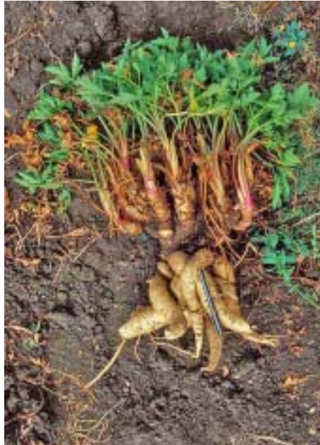
Fig. 1: Planta de arracacha ( Arracacia xanthorrhiza ) con tubérculos y cormelos con hojas por encima de las raíces engrosadas. Con 12 meses de edad cultivada en la colección de germoplasma de la Universidad Nacional de Cajamarca, Perú.

floración de cultivos generalmente es inducida por una baja temperatura o fotoperiodo o una combinación de ambos (Hiller & Kelly 1979, Peterson et al. 1993, Ramin & Atherton 1994). Bajaaná (1994) demostraron que ninguno de estos factores ya sea separados o combinados tiene efectos en la floración de arracacha. Más bien la deshidratación de las plantas maduras ha mostrado que induce la floración en una serie de experimentos preliminares (Bajaaná 1994, Hermann 1997, Sediyaama & Casali 1997). Sin embargo, estos experimentos no incluyen a un grupo control. En un reciente experimento, no se encontraron diferencias de floración entre el grupo control y los tratamientos de deshidratación (Knudsen et al. 2001). Todavía no se ha descrito un método confiable para inducir a la floración, esto también se aplica a la compatibilidad entre especies de Arracacia y razas del campo de arracacha, por lo tanto la biología floral en arracacha requiere mayor investigación. La umbela porta tanto flores