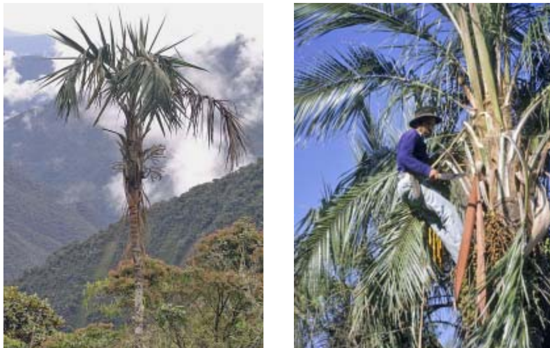
Fig. 6: a: Geonoma densa , un representante de elevadas altitudes del género Geonoma , que se distribuye en los Andes desde Venezuela hasta Bolivia. Foto: F. Borchsenius, provincia Nor Yungas, Bolivia. b: Cosecha de la fibra de Parajubaea sunkha . Foto: M. Moraes, provincia Vallegrande, Bolivia.

constituyen una fuente importante de marfil vegetal para tallar botones y otros artefactos (Acosta-Solís 1944, Perez Arbelaez 1956, Barfod 1989, Barfod et al. 1990, Pedersen 1993). Los botones de marfil vegetal o de tagua fueron alguna vez un producto mayor de Colombia y Ecuador. En la última mitad del siglo XXVIII la tagua fue uno de los cinco productos más importantes de exportación en Colombia (Bernal & Galeano 1999) y uno de los cinco más importantes productos del bosque en Ecuador (Acosta-Solís 1944). En Colombia la producción comenzó a declinar en los 1920 y luego desapareció en 1935. En Ecuador la producción tuvo su mayor pico en 1929 donde las exportaciones totalizaron hasta 25.000 toneladas métricas a un valor de más de $US 1.2 millones (correspondientes a más de $US 15