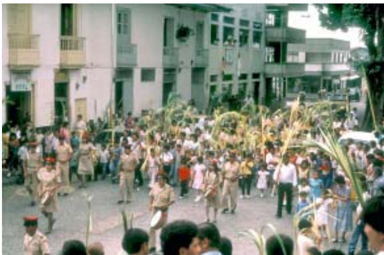
Fig. 4: Desfile durante el Domingo de Ramos con hojas de Ceroxylon , en Colombia.

corona de hojas y finalmente la muerte del individuo si esto se practica consecutivamente durante varios años (R. Bernal, com. pers. 2005).